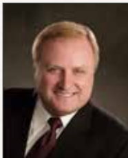
Hon. / L'hon. Sergio Marchi, PC President and CEO / Président et directeur général Canadian Electricity Association / l'Association Canadienne de l'électricité