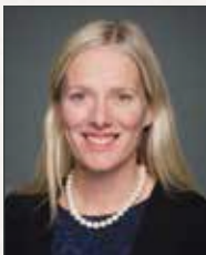
Hon. / L'hon. Catherine McKenna, PC, MP / Député Minister of Environment and Climate Change / Ministre de l'Environnement et du Changement climatique

Government of Canada / Gouvernement du Canada Monday Morning Speaker