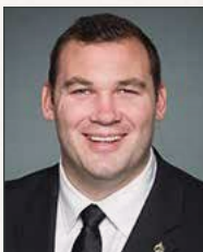
Alex Nuttall, MP / Député Barrie — Springwater — Oro-Medonte